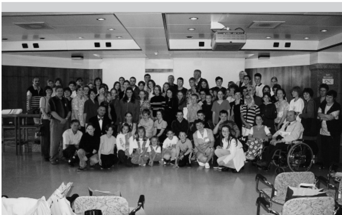
Skupinska slika iz podelitve priznanj v Ljubljani, dne 24.5.2000