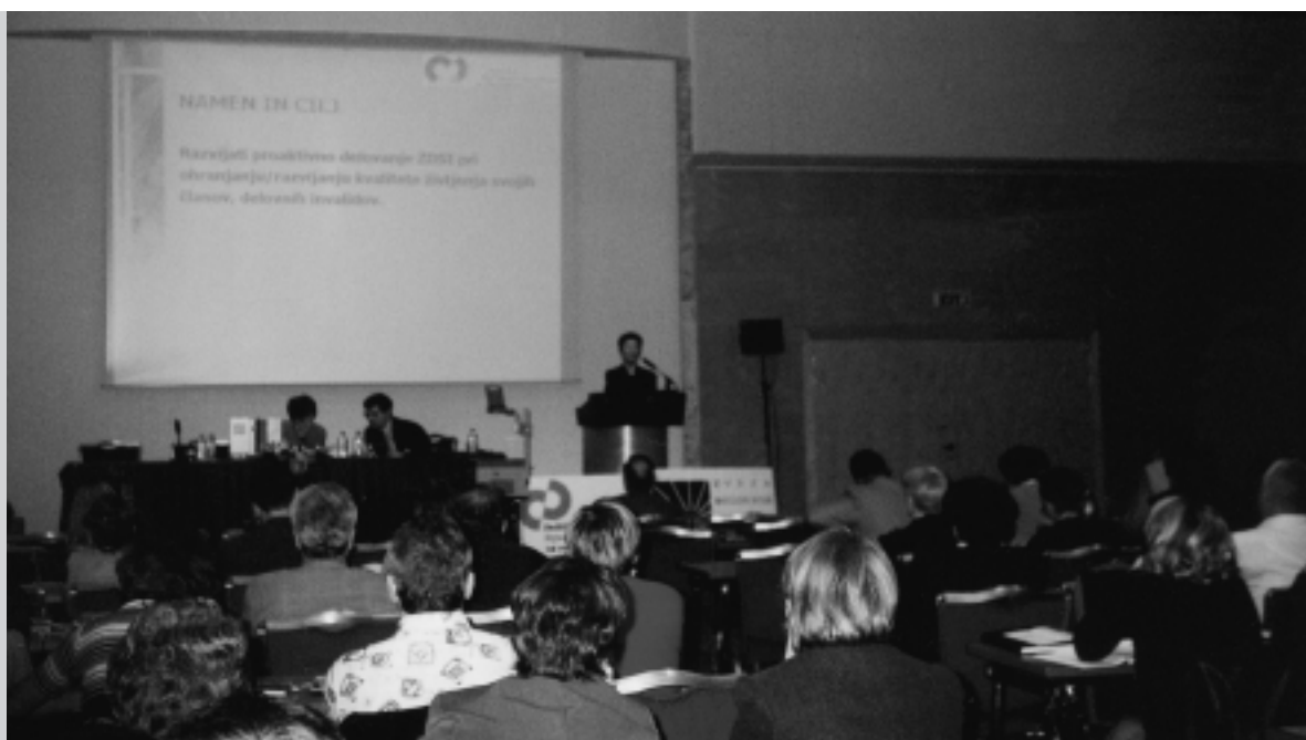
Simpozij v Portorožu, 3. - 4.11.2003