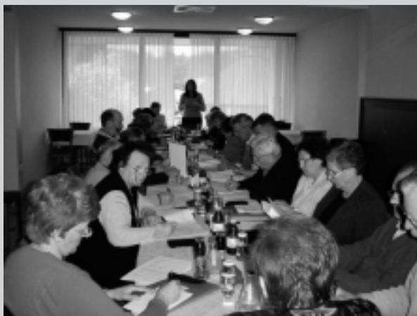
Udeleženci 4. delavnice na 2-dnevnem usposabljanju za delo in neposredno pomoč invalidom v Termah Olimia, 16-17.4.2004.