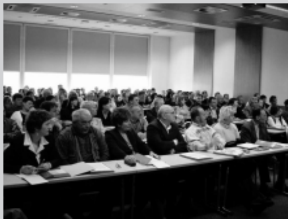
Udeleženci 2-dnevnega usposabljanja za aktivno življenje in delo v Termah Čatež od 8-9.5.2004