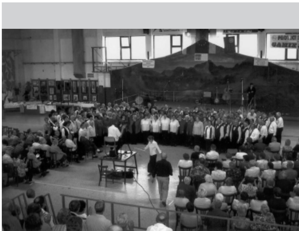
Skupinska slika iz 6. revije pevskih zborov DI ZDIS, Šentjur pri Celju, 31.05.2004

Prva revija pevskih zborov društev invalidov Zveze delovnih invalidov Slovenije je bila organizirana leta 1999 v počastitev 30. obletnice delovanja Zveze delovnih invalidov Slovenije, naslednje leto pa je postala tradicionalna.