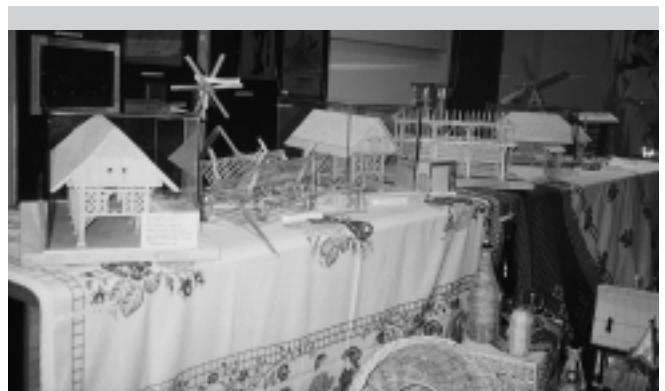
Iz razstave ustvarjalnosti invalidov DI ZDIS ob 30. obletnici ZDIS, 5. - 9.10.1999 v kongresni dvorani Mercurius v Ljubljani